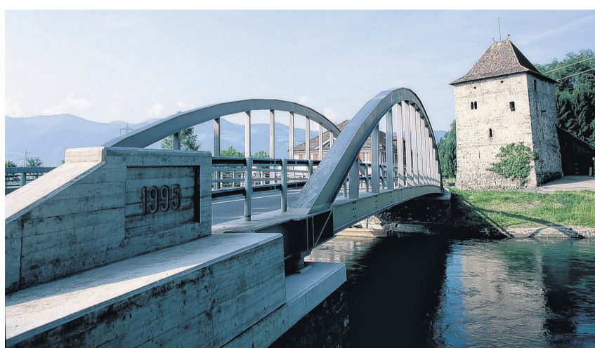
Die Bogenbrücke in der Grynau wird bis Mai 2025 saniert und verstärkt.

Während der Bauarbeiten bleibt die Brücke einseitig befahrbar. Eine Lichtsignalanlage regelt den Verkehr. Für den Langsamverkehr steht flussaufwärts