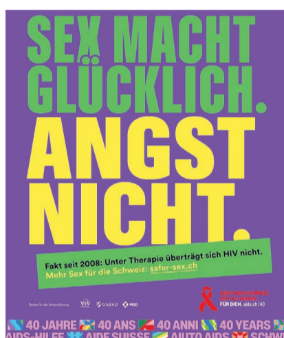
Die drei Slogans der nationalen Kampagne zum Welt-Aids-Tag von heute.